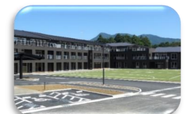
介護老人保健施設・介護付き有料老人ホーム菜の花の丘