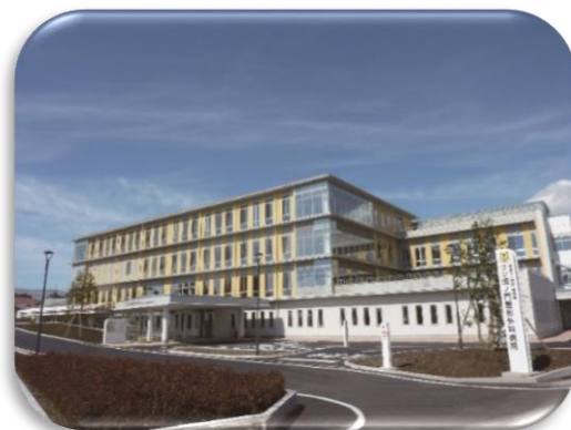
フジ虎ノ門整形外科病院