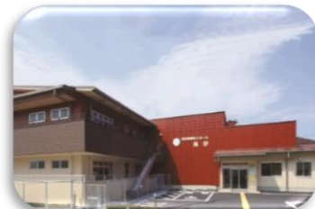
特別養護老人ホーム高砂