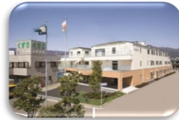
特別養護老人ホーム・高齢者住宅なでしこ