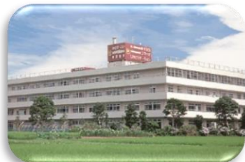
介護老人保健施設あすなろ