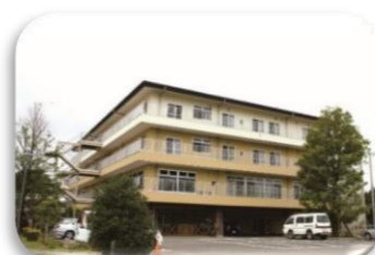
特別養護老人ホーム白雪