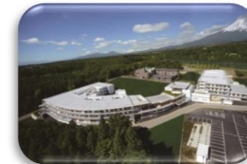
特別養護老人ホーム・ケアハウスすずらん サービス付き高齢者向け住宅ゆずり葉の森