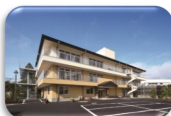
短期入所生活介護百寿